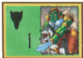
12 sereglapka – lovasság