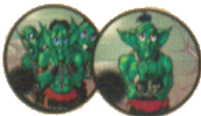
goblin rabszolgák (32 1-es és 24 3-as)

A játék tartozékai között található 1 szabályfüzet, egy másik, kisebb szabályfüzet, amely az eseményeket részletezi, 4 paraván, 4 műanyag talp (a hadurak számára), valamint egy csomó jelző: