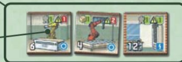
a piac (3 db X-lapka)