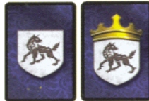
régi és új Házkártya hátoldala

A kiegészítőben új Házkártyák is találhatóak – egy-egy teljes készlet mind a hat Ház számára. Ezeknek az új Házkártyáknak a hátoldala eltér a régiektől: a Házak jelvényei felett egy-egy korona van. Ilyenformán könnyen megkülönböztethetőek a régi és az új Házkártyák.